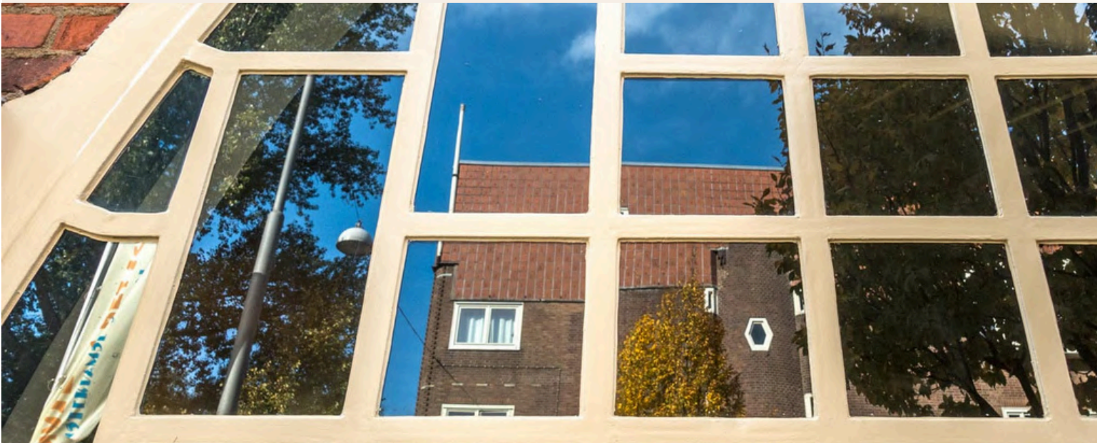
< Weerspiegeling van Blok I in het raam van het postkantoor

In het postkantoor bevindt zich de semipermanente tentoonstelling 'Een uitzonderlijk postkantoor', die tijdens de dagelijkse rondleidingen kan worden bekeken. De expositie geeft aan de hand van tekeningen van Michel de Klerk en historische foto's inzicht in de geschiedenis van het gebouw door de jaren heen. De vaste tentoonstelling in Museum De Dageraad besteedt aandacht aan de kunst en architectuur van Plan Zuid en de Amsterdamse School. Daarnaast is er een ingerichte stijkkamer en een ruimte voor tijdelijke tentoonstellingen, waarbij onderwerpen worden belicht die aansluiten bij Plan Zuid en/of bij de programmering in Museum Het Schip.