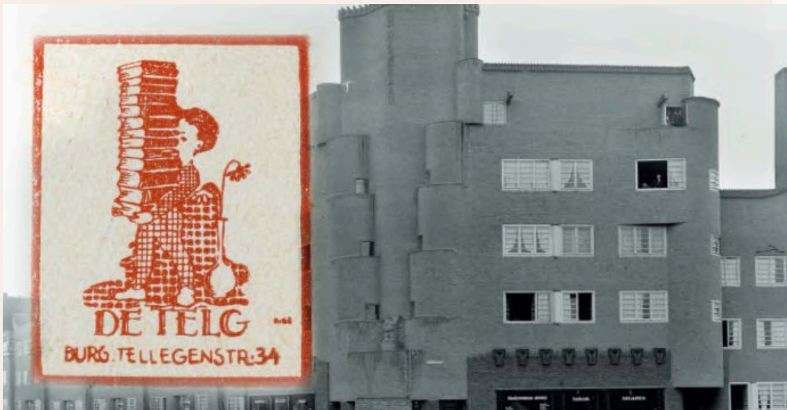
^ Key visual tentoonstelling, beeld Museum Het Schip

Hiernaast waren doorlopend de werken van Fabio Pravisani (beeldhouwer en bronsgieter) te zien in de lunchroom en in de museumwinkel. In het kader van de tentoonstelling over Michel de Klerk heeft Pravisani een bronzen borstbeeld van de architect vervaardigd, dat na de tentoonstelling een prominente plek krijgt in de vaste opstelling van het museum.