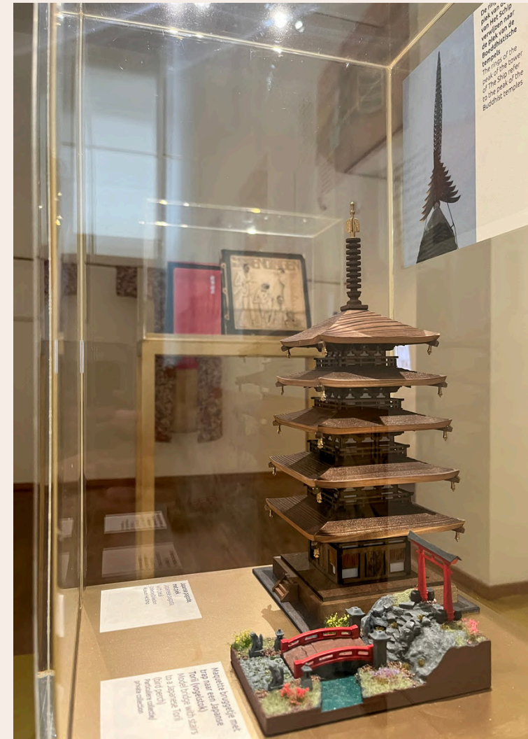
^ Zaalregistratie '1923: Horiguchi ontmoet de Amsterdamse School', beeld Museum Het Schip