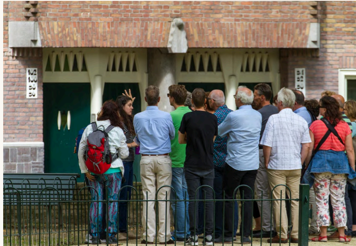
^ Rondleiding langs het Spaarndammerplantsoen, beeld Marcel Westhoff