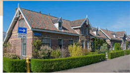
AGNETAPARK DELFT, NETHERLANDS Former company town

CONTACT ABOUT PARTICIPATE LOGIN EN - NL GARDEN CITIES • ORGANIZATIONS • ARTICLES • FORUM • AGENDA