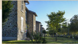
BEAUBLANC LIMOGES, FRANCE Mixed (housing association / municipality / other)