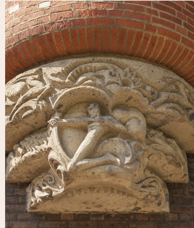
^ Detail van sculptuur op de gevel van Het Schip