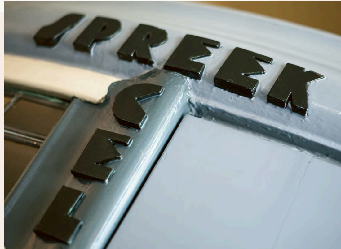
^ Detail van het postkantoor

Het personeels- en vrijwilligersbestand van Museum Het Schip is divers van samenstelling. Bij het museum werken mensen met wortels in diverse culturen, uit de LHBTQIA+ gemeenschap en met afstand tot de arbeidsmarkt. Twee medewerkers van het museum zijn via het programma Werk en Participatie van Gemeente Amsterdam aan de slag bij het museum. Komende jaren streven we naar het consolideren van de bestaande personeelsmix en het inclusief werven van nieuw personeel. In dit kader zijn in 2023 de vacatureteksten herschreven en voorzien van inclusief taalgebruik.