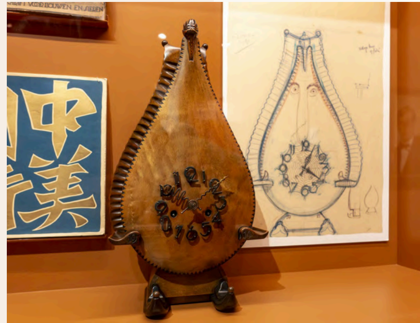
^ Klok van Michel de Klerk op zaad, beeld Marcel Westhoff