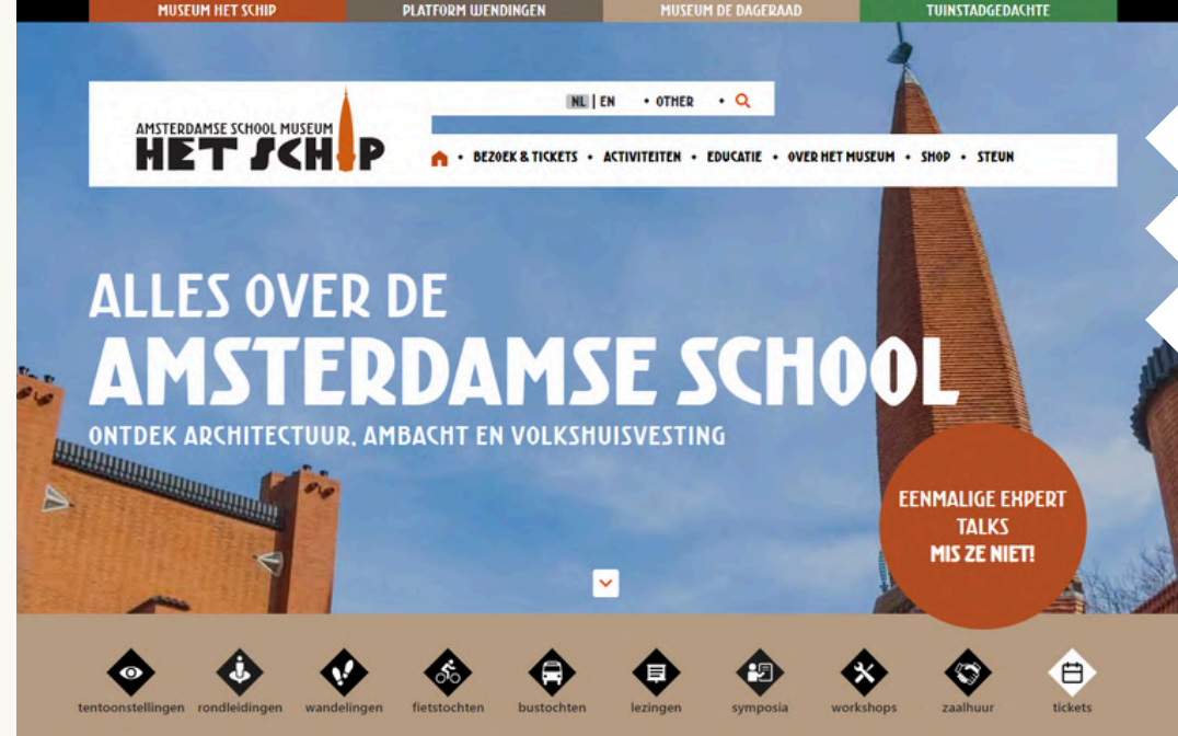
^ De website na herstructurering, beeld Museum Het Schip

In november 2023 onderzochten studenten van de Vrije Universiteit voor het vak 'Marketing and Corporate Communication for Impact' Hoe (I) jongeren tussen de 18 en 35 jaar oud en (II) ouders met kinderen van 4 –12 jaar oud beter kunnen worden bereikt. De aanbevelingen die hieruit volgden, zoals het inzetten van samenwerkingen in de buurt en het werken met kortingsacties, worden verder onderzocht en waar mogelijk in 2024 geïmplementeerd.