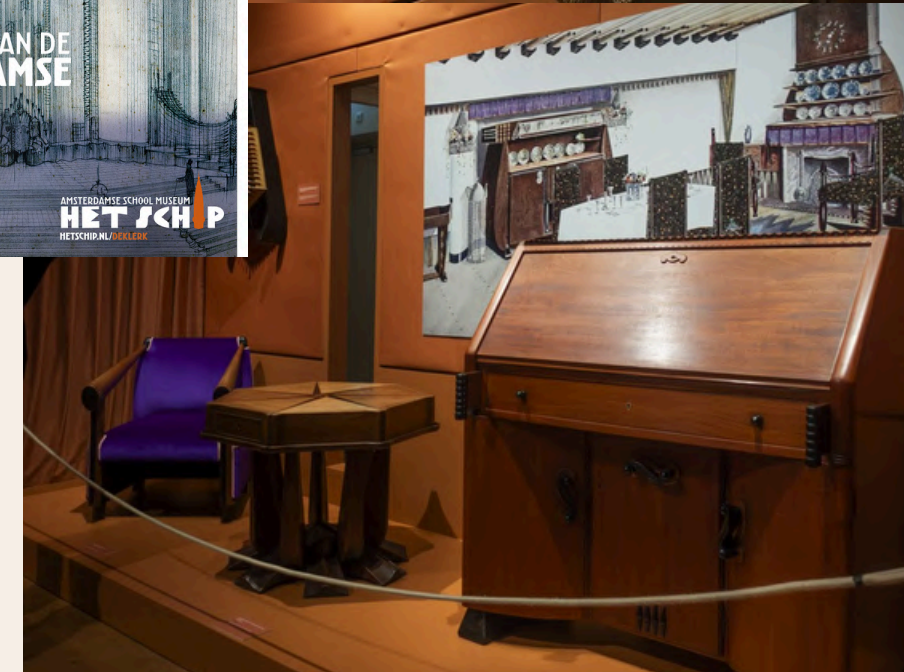
^ Zaalregistratie tentoonstelling, beeld Marcel Westhoff