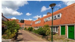
BLOEMENBUURT HILVERSUM HILVERSUM, NETHERLANDS Mixed (housing association / municipality / other)