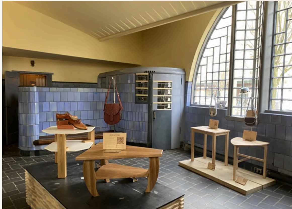
< De expositie van studenten Creatief Vakman aan het HMC in het postkantoor (april-juli 2023)

Het educatieve aanbod werd (verder) op maat ontwikkeld in samenwerking met verschillende onderwijsinstellingen. Zo werd begin juli 2023 met het Berlage Lyceum in Zuid voor de tweede keer het meerdaagse educatieprogramma georganiseerd bij De Dageraad. In drie dagen kwamen bijna 250 brugklasleerlingen langs voor een rondleiding rondom De Dageraad en een tekenworkshop. Vaste samenwerkingspartners bij het mbo zijn de Bouwacademie en het Hout- en Meubileringscollege (HMC). Met tweedejaars studenten Creatief Vakman van het HMC wordt jaarlijks een expositie in het postkantoor georganiseerd. Op het gebied van wo werkt het museum samen met de Universiteit van Amsterdam in het kader van de vakken Vrouwen en Kunst (bachelor Kunstgeschiedenis) en Future Societies Lab (Spatial Sustainable Studies, onderdeel van de master Planologie en Sociale Geografie).