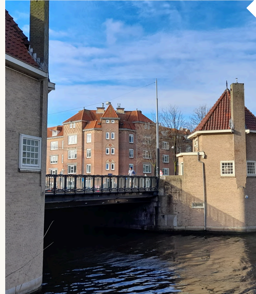
^ Kenmerkende Amsterdamse School-brug in Amsterdam Zuid

Een zo divers mogelijk publiek inspireren, verrijken en actief betrekken bij het verhaal van de Amsterdamse School als belangrijke stroming op het gebied van (toegepaste) kunst, architectuur en volkshuisvesting.