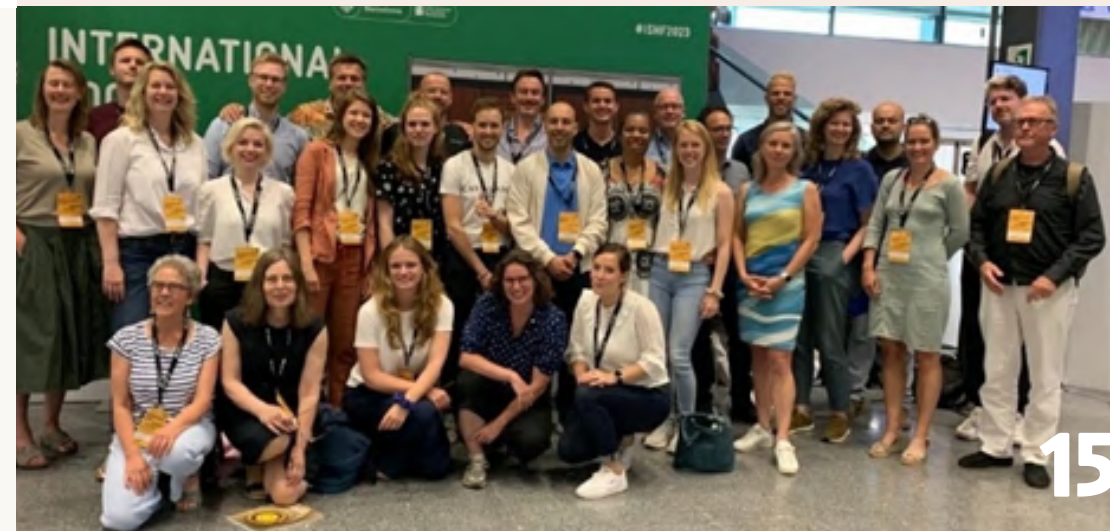
Onder: de Nederlandse delegatie op het ISHF

World Garden Cities is een online interactief kennis- en netwerkplatform dat in 2022 werd gelanceerd en in 2023 is uitgebreid. Op het platform worden tuinstadbewoners, huurdersorganisaties, gemeenten, architecten, beleidsmakers, historische- en erfgoedverenigingen met elkaar verbonden. Er wordt aandacht besteed aan tuinstad-gerelateerd nieuws, evenementen en (wetenschappelijke) publicaties. De openbaar toegankelijke database speelt een belangrijke rol bij de (voorbereidingen van de) World Garden City Conference (5-7 juni 2024) en de tentoonstelling Het Paradijs van de Arbeider. Tuinsteden en Tuindorpen (10 oktober 2024 - 28 juli 2025). Voor Museum Het Schip is het platform een belangrijk instrument ter versterking van de spilfunctie die het museum vervult binnen de volkshuisvesting.