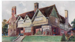
BOURNVILLE BIRMINGHAM, UNITED KINGDOM Former company town