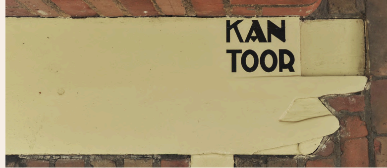
< Detail van het Vergaderhuisje, onderdeel van het museumcomplex

Het museumbureau draagt zorg voor het goed kunnen uitvoeren van de museumtaken. Hieronder vallen de afdelingen collectie, educatie, marketing en planning. In de afgelopen jaren is een professionalisering doorgevoerd en zijn functies geleidelijk ingevuld door specialisten. In 2023 is verder gewerkt aan de professionalisering en zijn de medewerkers marketing & communicatie, educatie en collectie doorgroeid naar de coördinatorfunctie binnen hun afdeling; zij sturen een team van vrijwilligers en zzp'ers aan. In 2024 wordt een vervolgstap gemaakt in de professionalisering en versterking van de organisatie en zijn vier tijdelijke medewerkers ingehuurd op het gebied van beleid, educatie, financiën en programmering.