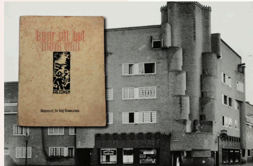
^ Key visual tentoonstelling 'De Telg', beeld Museum Het Schip