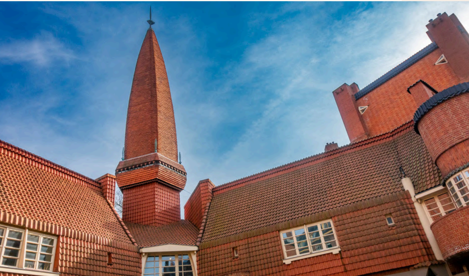
< De toren van Museum Het Schip

De hogere bijdrage werd met name veroorzaakt door extra kosten voor het onderhoud en (onvoorziene) reparaties van de klimaatinstallatie. Vanwege de te verwachten hoge kosten voor een nieuwe klimaatinstallatie in de komende jaren houdt Museum het Schip vast aan de dotatie van € 100.000 per jaar.