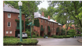
CHATHAM VILLAGE PITTSBURGH, UNITED STATES Mixed (housing association / municipality / other)