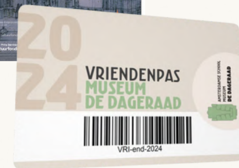
^ Verschillende uitingen met een consequente huisstijl