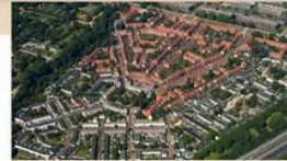
BETONDORP AMSTERDAM, NETHERLANDS Mixed (housing association / municipality / other)