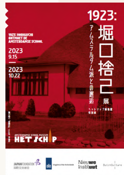
< Beeld: Naar het Japans vertaalde key visual voor de tentoonstelling door Museum Het Schip (vertaling Masaru Saito)